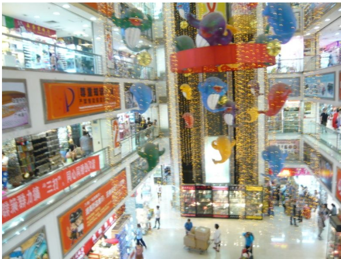
▲ 深センの市場の様子

日本人が大好きな香港から2時間以内で行けるので、慣れれば短期間で大きな仕入れも出来ます。